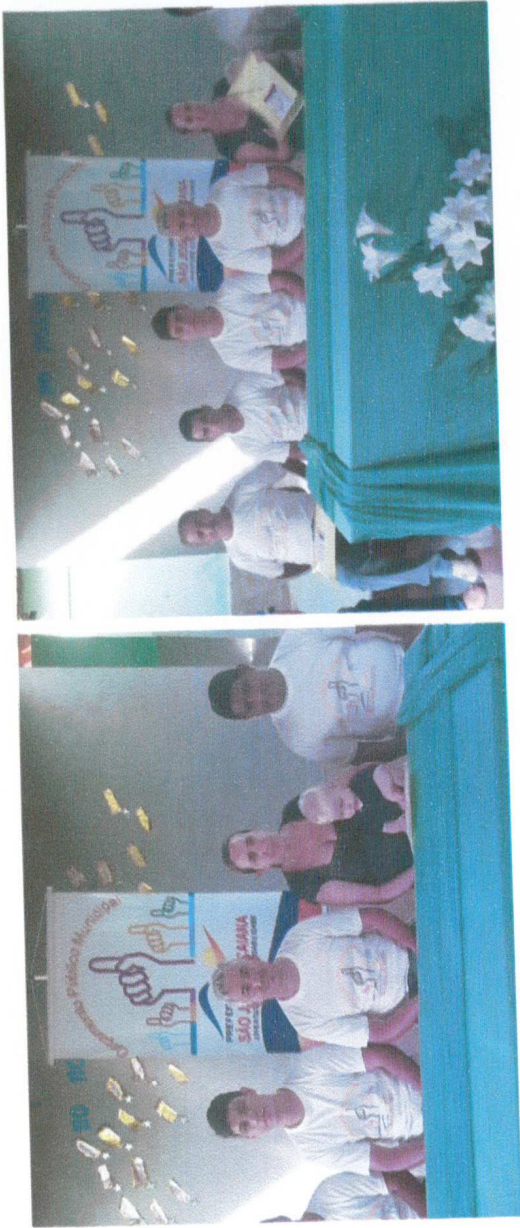
Mesa Formada Autoridades: Secretários Municipais, Vereadores, Representantes da Sociedade e Convidados.