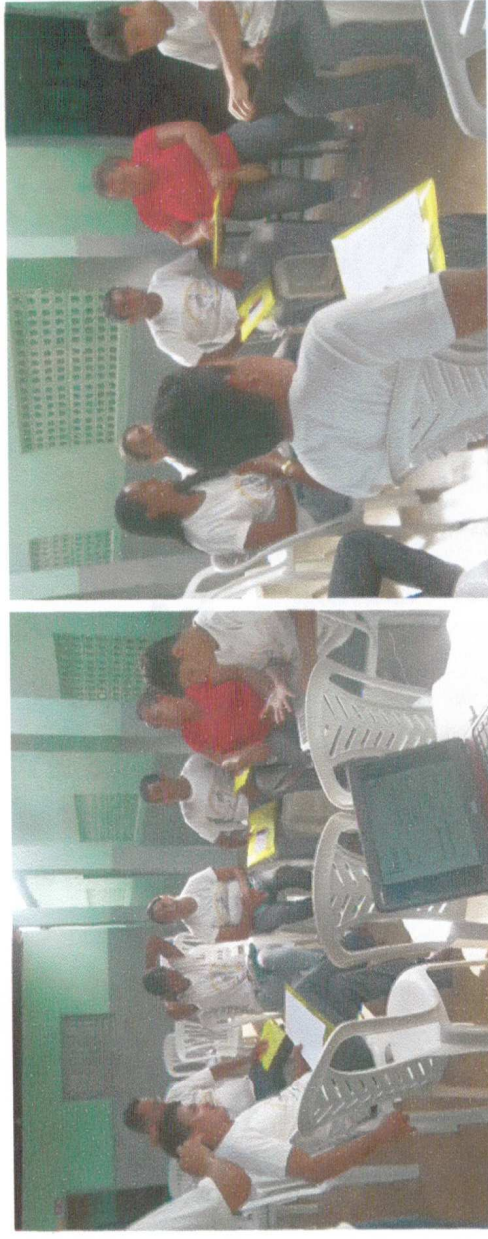
Grupo Zona Rural