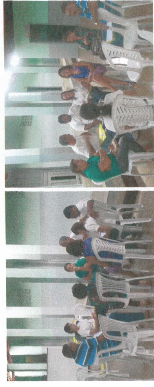
Grupo Zona Urbana